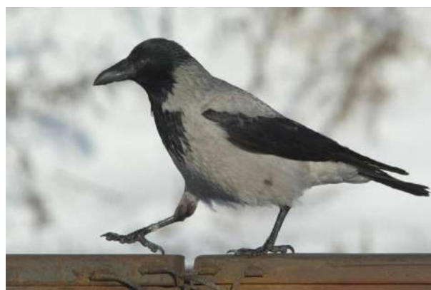
2. Ворона серая