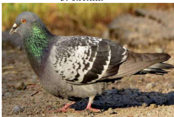
5. Голубь сизый