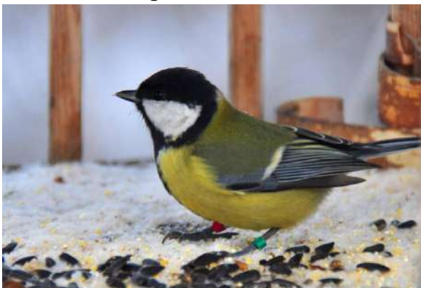
11. Синица большая