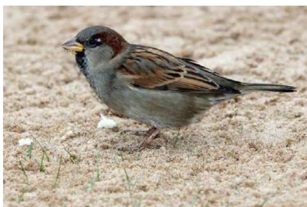
1. Воробей домовый