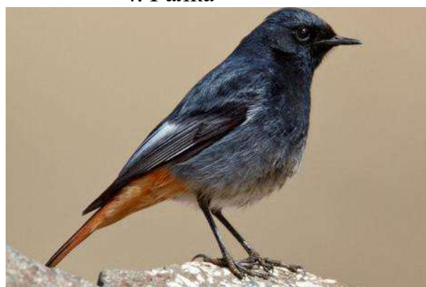
6. Горихвостка чернушка