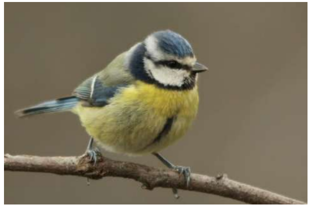
8. Лазоревка обыкновенная